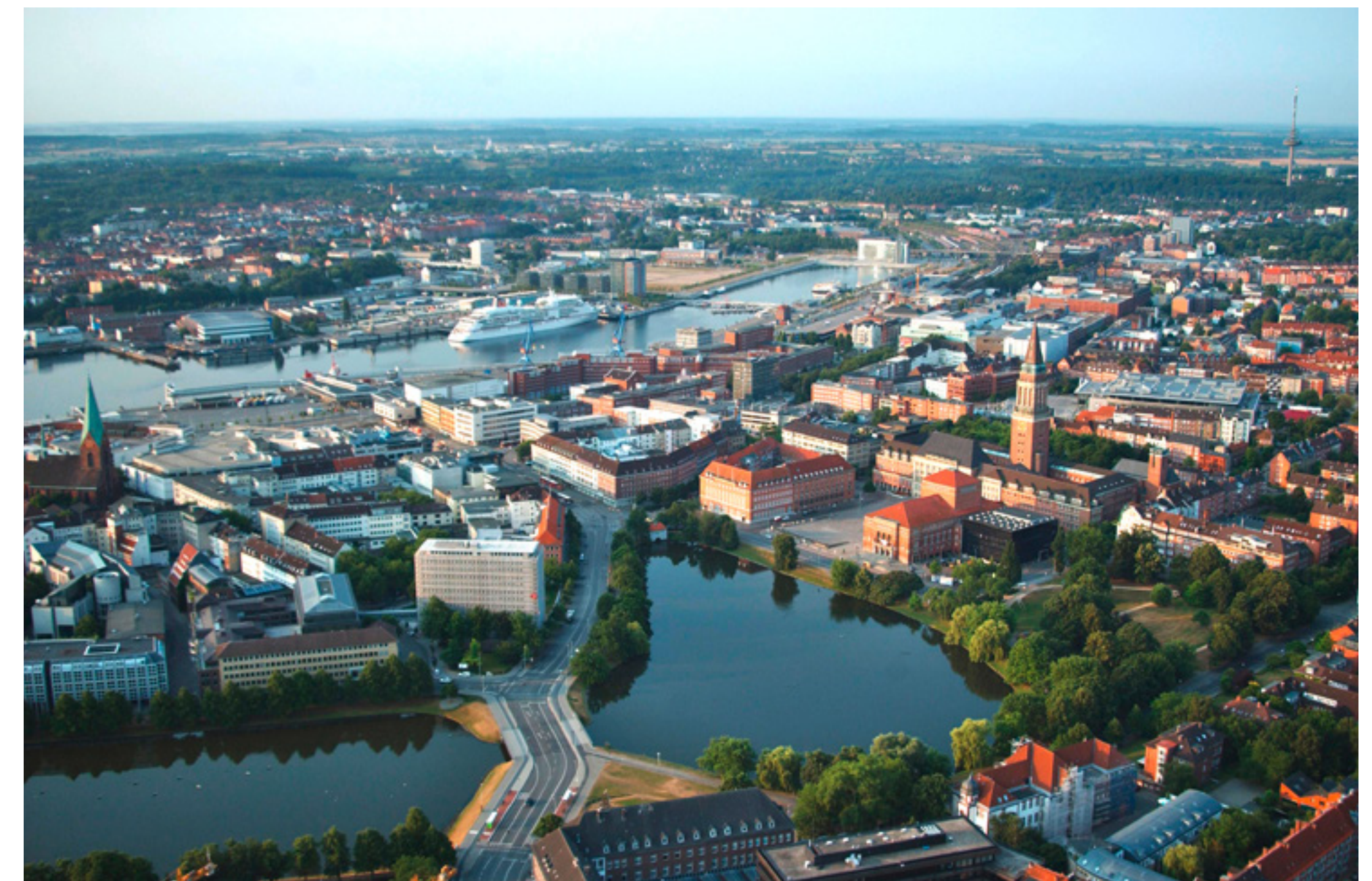
Kieler Förde und kleiner Kiel. The Kieler Förde inlet and Kleiner Kiel lake.

“ SEA, NATURE, URBAN CENTRES AND CULTURE: SCHLESWIG-HOLSTEIN SIMPLY OFFERS EVERYTHING. ”